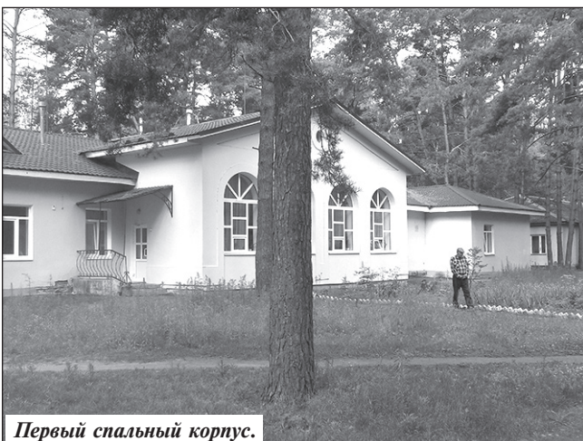
Первый спальный корпус.

Профессия социального работника призвана нести в жизнь идеалы справедливости и милосердия. На их плечи ложатся беды и проблемы людей, нуждающихся в особом внимании и заботе. Мы стремимся создать обстановку, максимально приближенную к домашней, чтобы нашим подопечным было комфортно. В следующем году запланирован капитальный ремонт здания школы, рассчитанной на 60 человек, ремонт спортивного и актового залов, библиотеки.